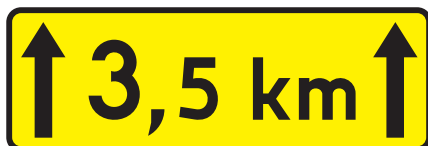
Rys. 2.1.4.1. Tabliczka T-2

Tabliczka T-2 (rys. 2.1.4.1) podaje długość odcinka drogi, na którym występuje niebezpieczeństwo. Stosuje się ją ze znakami ostrzegawczymi, w celu poinformowania, że niebezpieczeństwo, o którym ostrzegają te znaki powtarza się lub występuje na odcinku drogi o długości przekraczającej 0,5 km. Długość tego odcinka podaje się w km z jedną cyfrą po przecinku z dokładnością do 0,5 km.