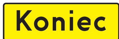
Rys. 2.1.4.2. Tabliczka T-3

Tabliczka T-2 (rys. 2.1.4.1) podaje długość odcinka drogi, na którym występuje niebezpieczeństwo. Stosuje się ją ze znakami ostrzegawczymi, w celu poinformowania, że niebezpieczeństwo, o którym ostrzegają te znaki powtarza się lub występuje na odcinku drogi o długości przekraczającej 0,5 km. Długość tego odcinka podaje się w km z jedną cyfrą po przecinku z dokładnością do 0,5 km.