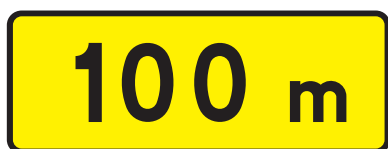
Rys. 2.1.3.1. Tabliczka T-1

Tabliczka T-1 (rys. 2.1.3.1) podaje rzeczywistą odległość znaku ostrzegawczego od miejsca niebezpiecznego. Tabliczkę T-1 umieszcza się pod znakiem ostrzegawczym w przypadku, gdy ze względów lokalnych nie można umieścić znaku w odległości określonej w punkcie 2.1.2 oraz pod znakiem dodatkowym umieszczonym w odległości większej niż określone w punkcie 2.1.2. Rzeczywistą odległość podaje się w metrach, z dokładnością do 10 m.