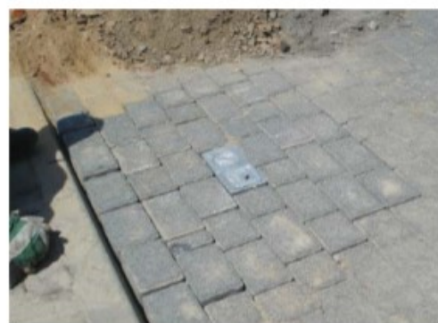
6) Ostrożnie zdemontować słupek, zamknąć wszystkie pokrywy gniazda i pozostawić do związania. Miejsce montażu zabezpieczyć przed dostępem osób nieupoważnionych.

Uwaga: Jeśli konsystencja użytego betonu nie pozwala na obudowanie gniazda, to fundament należy pozostawić do związania.