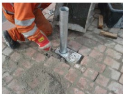
Uwaga: Przestrzeń pod i wokół gniazda należy wypełnić betonem.