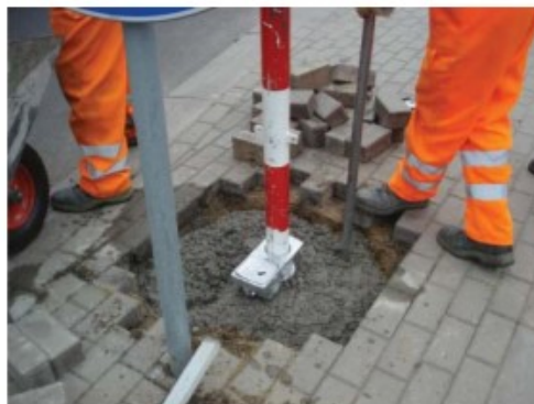
Istnieje możliwość zainstalowania gniazda obok istniejącego oznakowania i po związaniu fundamentu przeinstalowania słupka wraz ze znakiem.