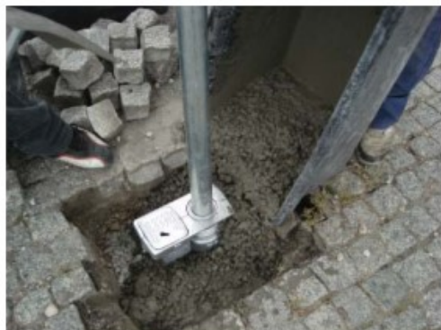
4). Wypełnić otwór betonem (klasa betonu C16/C20)