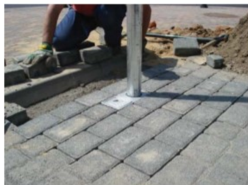
5). Sprawdzić czy słupek montażowy wraz z gniazdem jest w pionie. W przypadku użycia tzw. betonu półsuchego, bezpośrednio po wypełnieniu otworu betonem można przystąpić do obudowania gniazda dowolną nawierzchnią.

Uwaga: Jeśli konsystencja użytego betonu nie pozwala na obudowanie gniazda, to fundament należy pozostawić do związania.