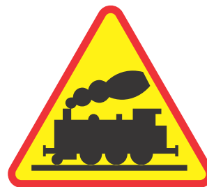
Rys. 2.2.11.1. Znak A-10

Znak A-10 „przejazd kolejowy bez zapór” (rys. 2.2.11.1) stosuje się przed przejazdami kolejowymi bez zapór lub półzapór - wyposażonymi w samoczynną sygnalizację świetlną (kategoria C) lub nie wyposażonymi w żadne z wymienionych urządzeń (kategoria D). Zasady oznakowania przejazdów kolejowych znakiem A-10 są analogiczne jak znakiem A-9, które określono w punkcie 2.2.10.