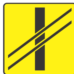
Rys. 2.2.11.2. Tabliczka T-7

Znak A-10 „przejazd kolejowy bez zapór” (rys. 2.2.11.1) stosuje się przed przejazdami kolejowymi bez zapór lub półzapór - wyposażonymi w samoczynną sygnalizację świetlną (kategoria C) lub nie wyposażonymi w żadne z wymienionych urządzeń (kategoria D). Zasady oznakowania przejazdów kolejowych znakiem A-10 są analogiczne jak znakiem A-9, które określono w punkcie 2.2.10.