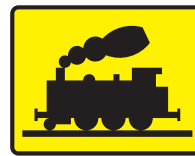
Rys. 2.2.32.2. Tabliczka T-10

Tabliczkę T-10 (rys. 2.2.32.2) umieszcza się przed takimi miejscami przecięcia drogi przez bocznicę kolejową lub tor manewrowy lub linię kolejową wykorzystywaną sporadycznie np. w celach turystycznych, na których ruch na drodze podczas przejeżdżania (przetaczania) pociągu jest wstrzymywany przez pracownika kolei. W przypadkach określonych w punkcie 2.2.11 pod tabliczką T-10 można umieścić tabliczkę T-7.