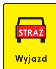
Rys. 2.2.32.12. Tabliczka T-16

Tabliczkę T-16 i jej odmianę stosuje się przed miejscami, w których pojazdy uprzywilejowane często wjeżdżają na drogę, np. przy wyjazdach z garaży straży pożarnej. Znak A-30 z tabliczką T-16 powinien być stosowany zawsze, jeżeli podczas wyjazdu pojazdów uprzywilejowanych jest uruchamiana specjalna sygnalizacja świetlna zamykająca ruch na drodze. W wymienionych miejscach umieszcza się: