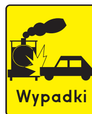
Rys. 2.2.32.10. Tabliczka T-14d