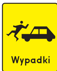
Rys. 2.2.32.6. Tabliczka T-14

Tabliczkę T-14 i jej pięć odmian, stosuje się przed miejscami szczególnie niebezpiecznymi, ustalonymi na podstawie analizy bezpieczeństwa ruchu drogowego. Analizę należy przeprowadzić, jeżeli w ciągu roku zdarzyły się co najmniej cztery wypadki określonego rodzaju z ofiarami w ludziach, na odcinku drogi o długości 1 km poza obszarem zabudowanym, a 0,5 km w obszarze zabudowanym lub co najmniej dwa wypadki na przejeździe kolejowym. Znak A-30 z tabliczką pokazującą rodzaj zdarzających się wypadków umieszcza się wtedy, kiedy nie ma możliwości szybkiej poprawy istniejących warunków bezpieczeństwa ruchu. Tabliczki te są następujące: