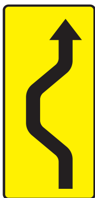
Rys. 2.2.32.15. Tabliczka T-18

Odległość umieszczenia znaku A-30 z tabliczką T-17 należy ustalać w stosunku do znaku B-32, jeżeli przekraczanie granicy jest dozwolone, a do znaku F-2 - jeżeli jest zabronione.