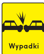
Rys. 2.2.32.8. Tabliczka T-14b