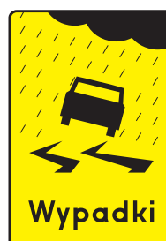
Rys. 2.2.32.11. Tabliczka T-15

Tabliczkę T-15 (rys. 2.2.32.11) umieszcza się przed miejscem częstych wypadków lub kolizji spowodowanych śliską nawierzchnią drogi występującą w czasie lub po opadach deszczu albo mżawki.