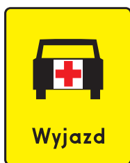
Rys. 2.2.32.13. Tabliczka T-16a

– tabliczkę T-16a (rys. 2.2.32.13), jeżeli na drogę wyjeżdżają karetki pogotowia ratunkowego. Tabliczki T-16, T-16a stosuje się samodzielnie bezpośrednio przed miejscem wyjazdu.