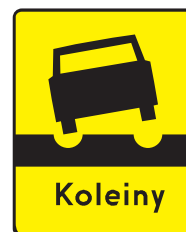
Rys. 2.2.32.5. Tabliczka T-13

Tabliczkę T-12 (rys. 2.2.32.4) umieszcza się przed początkiem podłużnego uskoku nawierzchni, powstałego wskutek okresowo przerywanych robót drogowych lub podczas trwania takich robót.