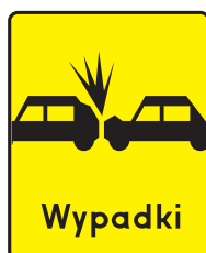
Rys. 2.2.32.7. Tabliczka T-14a