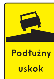
Rys. 2.2.32.4. Tabliczka T-12

Tabliczkę T-11 (rys. 2.2.32.3) umieszcza się przed dojazdem do promu. Bezpośrednio przed miejscem wjazdu na prom powinien być umieszczony znak B-32d uzupełniony ewentualnie sygnalizacją świetlną z sygnałem czerwonym.