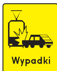
Rys. 2.2.32.9. Tabliczka T-14c