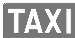
Rys. 5.2.19.1. Znak D-19

Znak D-19 „postój taksówek” (rys. 5.2.19.1) stosuje się w celu oznaczenia początku odcinka jezdni przeznaczonego tylko dla postoju taksówek osobowych. Znak D-19 powinien mieć wymiary: długość podstawy 620 mm, wysokość 300 mm.