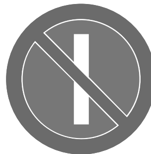
Rys. 3.2.38.1. Znak B-37

Znak B-37 „zakaz postoju w dni nieparzyste” (rys. 3.2.38.1) stosuje się przede wszystkim w miastach, w celu udostępnienia jednej strony jezdni, co drugi dzień, dla potrzeb, np. zaopatrzenia sklepów, sprzątania drogi, usuwania śniegu.