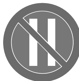
Rys. 3.2.39.1. Znak B-38

Znak B-38 „zakaz postoju w dni parzyste” (rys. 3.2.39.1) stosuje się w takim samym celu i według takich samych zasad jak znak B-37 (pkt 3.2.38). Znak ten obowiązuje w dni parzyste miesiąca. Powinien być umieszczany po stronie parzystej ulicy (parzyste numery posesji).