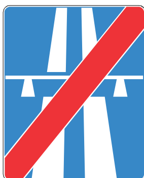
Rys. 5.2.10.1. Znak D-10

Znak D-10 „koniec autostrady” (rys. 5.2.10.1) stosuje się w celu oznaczenia końca autostrady. Znak D-10 umieszcza się na końcu jezdni głównej autostrady i łącznicach wjazdowych z autostrady. Jeżeli autostrada prowadzi do przejścia granicznego, wtedy znak D-8 umieszcza się pod znakiem A-30 z tabliczką T-17 wskazującą granicę państwa.