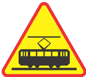
Rys. 2.2.23.1. Znak A-21

Znak A-21 „tramwaj” (rys. 2.2.23.1) stosuje się, jeżeli tory tramwajowe przecinają drogę w takim miejscu lub w taki sposób, że kierujący pojazdami mogą nie zorientować się dostatecznie wcześniej o istnieniu tych torów lub o ich przebiegu. Znak ten umieszcza się dla tego kierunku ruchu, który jest przecinany przez tory tramwajowe.