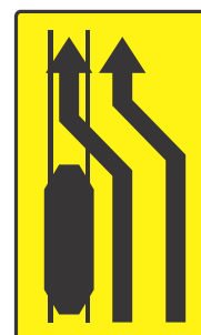
Rys. 2.2.23.3. Tabliczka T-8