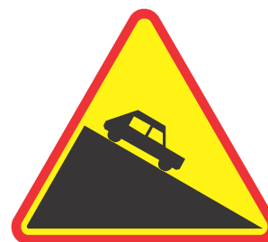
Rys. 2.2.24.1. Znak A-22

Znak A-22 „niebezpieczny zjazd” (rys. 2.2.24.1) umieszcza się przed spadkami podłużnymi drogi wynoszącymi na drogach położonych w terenie górzystym co najmniej 10%, a na pozostałych drogach co najmniej 7%. Jeżeli jednak jednocześnie występują takie warunki drogowe, jak np.: duży spadek poprzeczny, ostry zakręt, zły stan lub mała szerokość jezdni, znak A-22 stosuje się nawet przy